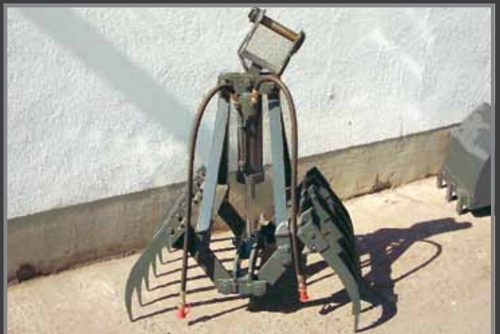
Dunggreifer 2 x 6 Zinken mit Arbeitszylinder