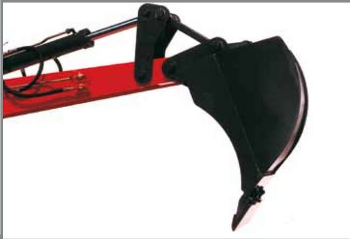
Tieflöffel mit Zahnschutz zum Abziehen und zur sicheren Drainage