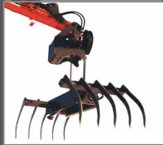
Kettenantrieb für Tiefsiloentnahme