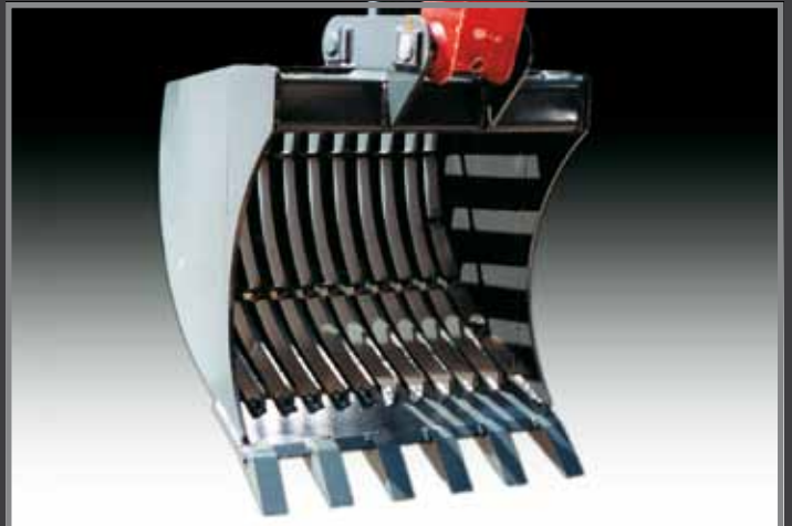
Tieflöffel zum Roden