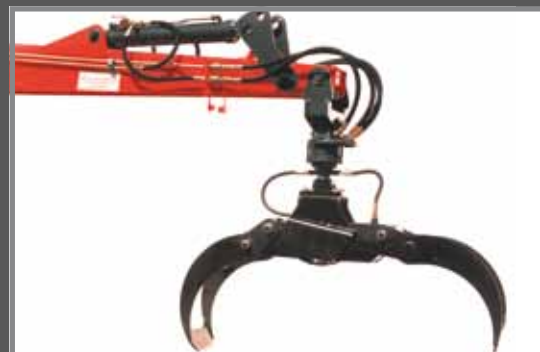
Holzzange (Zangenöffnung 1290 mm)