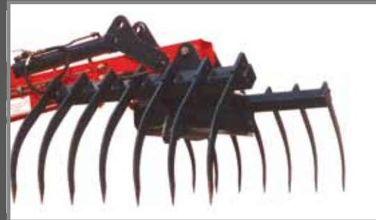
Großvolumengreifer (Öffnungsweite 1600 mm)