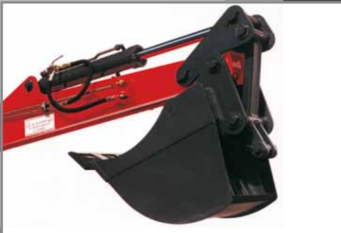
Tieflöffel mit Zwangssteuerung bei schwerem Boden (Lehm)